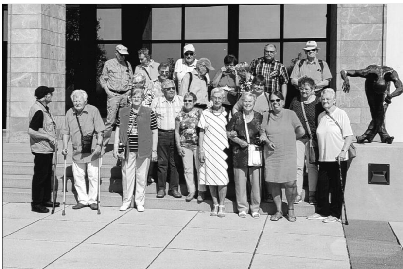
Teilnehmer an der Exkursion am 7. September 2024