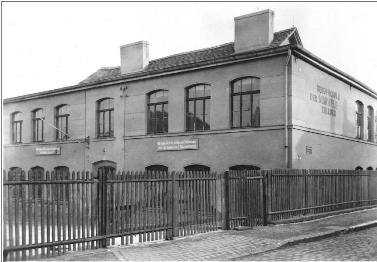
Abb. Nr. 2

sammenlegung der vielen kleinen Schulen auf weniger, aber größere Schulstandorte. Betrieben wurden von dieser Zeit an drei Schulen und zwar in Eisleben, Kleine Rammtorstraße 1 (Abb. 2), in Helbra auf der Kochhütte und in Burgörner-Neudorf (Hettstedt) auf dem Zionskirchplatz unweit des viel später erbauten Klubhauses der Walzwerker. Die Eisleber Schule war zuerst bezugsfertig, während in Helbra und Burgörner vorhandene Gebäude für Schulzwecke umgebaut werden mussten. Was nun zum Gebäudekomplex Kleine Rammtorstraße weniger bekannt ist, soll an dieser Stelle noch eingefügt werden. 1893 hieß diese Straße noch ‚Am Preußischen Hof‘ und die Nr.1 war bis dahin ein Gasthof, der passend zum Straßennamen ‚Zum Kronprinz‘ hieß und der war