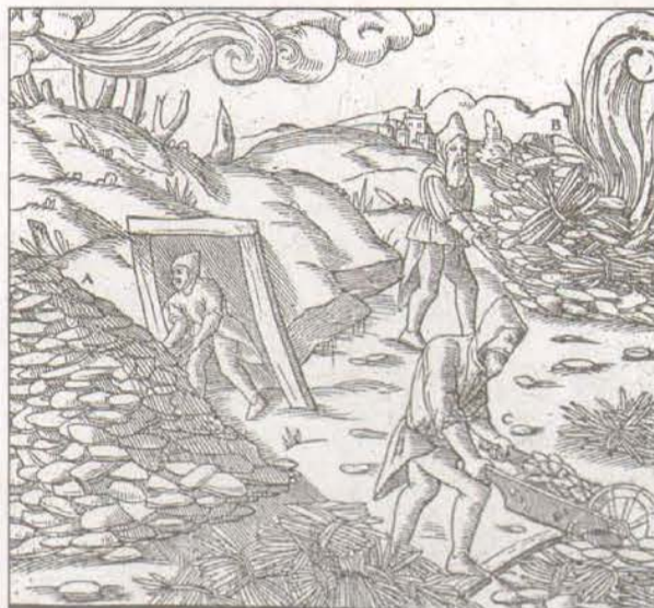
„Brennen“ des Kupfers.

Somit widerspiegeln die beiden Namen den Verarbeitungsgang des Kupferschiefers, dessen Hauptproblem im metallurgischen Sektor lag. Denn sowohl Kenntnis als auch das Beherrschen des notwendigen totalen Verschmelzens gingen weit über den damaligen Wissensstand hinaus, auch die Fähigkeit, die dazu erforderlichen Apparaturen (große Blasebälge; Nutzungsmöglichkeit von Wasserkraft mittels Wasserräder und Übertragungsmechanismen zum Antrieb der Bälge) zu bauen; das war hochspezialisiertes