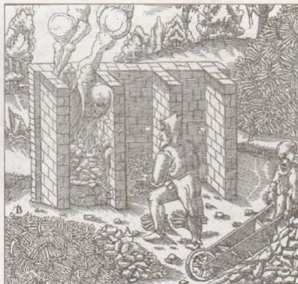
Röstschächte zum Rösten des Kupfers.

Es könnte reiner Zufall gewesen sein, daß die „Entdeckung“ in Hettstedt geschah und nicht an einem anderen, in der Nähe des Lagerstät-