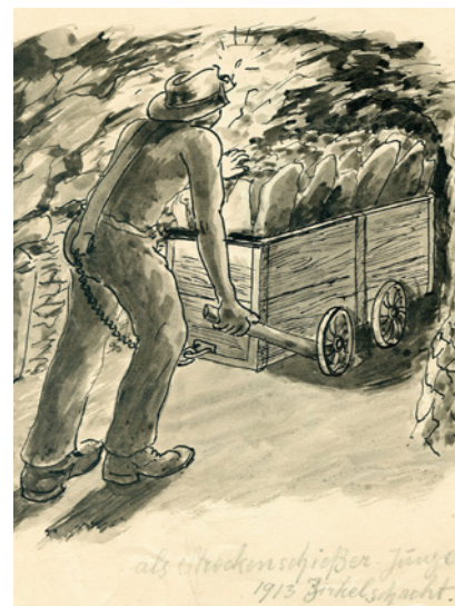
Franz Schneemann: Als Streckenschießer Junge 1913 Zirkelschacht.

Ein weiteres Bild aus seiner frühen Bergmannszeit zeigt die Arbeit eines Häuers, des Streckenschießers, bei der Auffahrung einer Strecke. Sie verläuft durch das Versatzfeld, d. h. durch den „Alten Mann“, eines Streb. Die Strecke folgt in ihrem Verlauf einer im Versatz ausgesparten Förderfahrt. Gut zu erkennen der mit Versatz und Holzstempeln verfüllte ehemalige Strebraum. Darüber steht der Zechsteinkalk an. Dieser musste zur Schaffung der Strecke hereingesprengt werden. Dafür waren Bohr- und Sprengarbeiten sowie die Abförderung des hereingesprengten Gesteinsmaterials mit dem vorher beschrie-