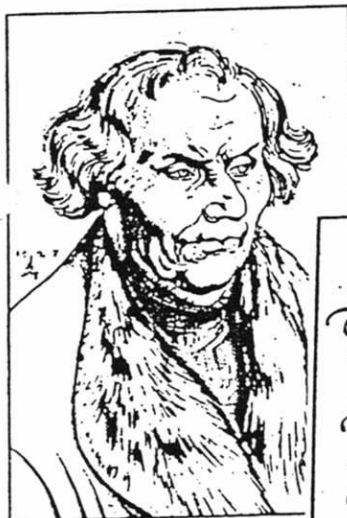
Hans Luder nach einem Gemälde Lucas Cranachs d.Ä. aus dem Jahre 1527