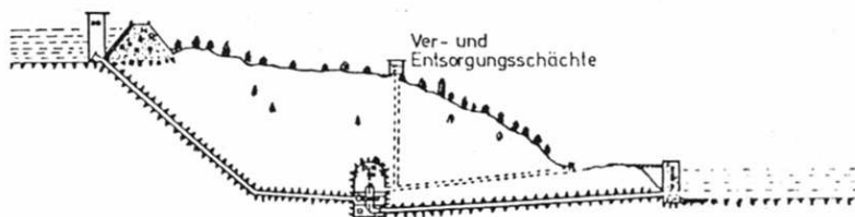
Schnitt der Anlagen des PSW Markersbach

Als wichtigstes Vorhaben sind die Auffahrungen für das Pumpspeicherkraftwerk Markersbach zu nennen.