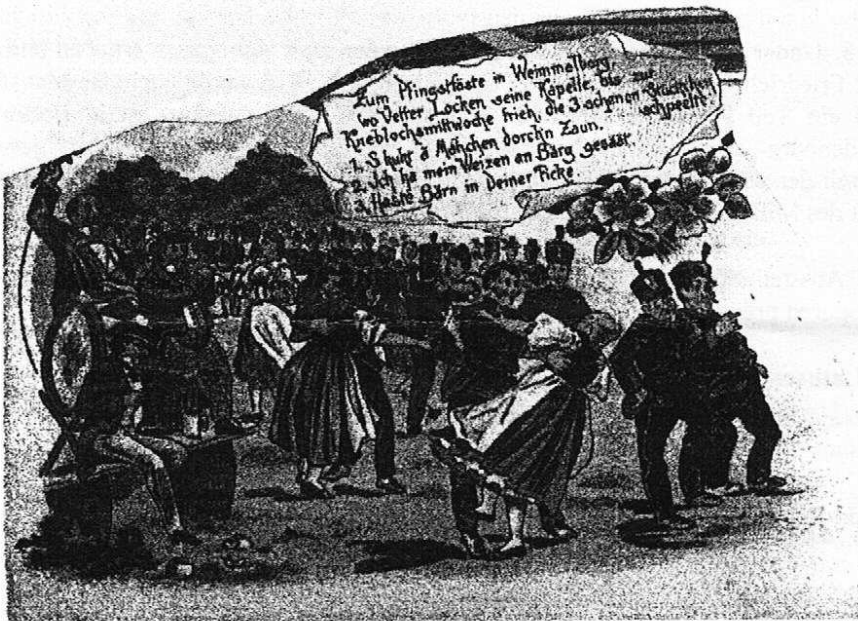
Ausschnitt aus einer alten Eisleber Postkarte

Harte Arbeit und frohe Feste hatten auch im Mansfelder Land schon immer ihre ganz besondere Bedeutung. Für die Schwere der Arbeit standen das Berg- und Hüttenwesen, für das Vergnügen vor allem der Wiesenmarkt, der vom Pferdemarkt zum jährlichen Volksfest für alle Bevölkerungsschichten wurde, aber auch die Pfingstfeste, mit dem sich wiederholenden Ritual zum Frühlingsbeginn. Berg- und Hüttenleute durften dabei nicht fehlen. Im Laufe der Zeit sind Stadt- und Dorffeste und ein kaum überschaubares Freizeitangebot auch im Mansfelder Land zur Tradition geworden.