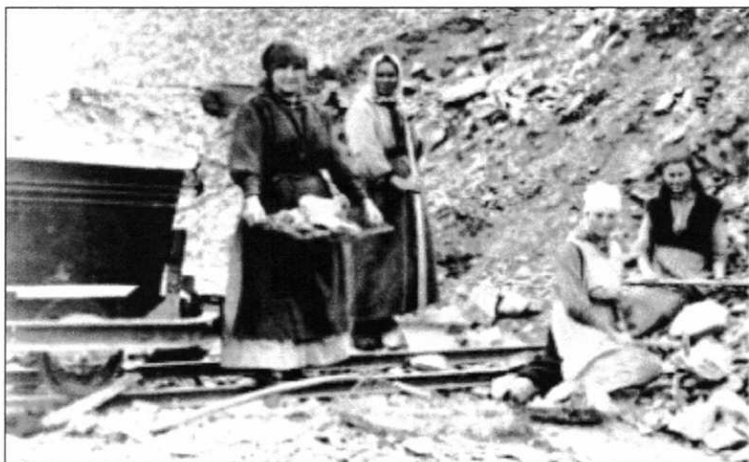
Der "Mansfelder Kläuberin" (hier ein Bild von der Haldenkläubung während des I. Weltkrieges) wurde im Festumzug ein eigenes Laufbild gewidmet.

Zur Philosophie des Festumzuges gehörte auch, Situationen sichtbar zu machen, die das Leben des Bergmanns beeinflusst haben. Neue Laufbilder, wie die "Mansfelderin" oder "Die Frau als Kläuberin", die über Jahrhunderte die schwersten Arbeiten zu verrichten hatten.