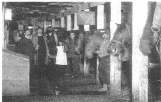
Pferdestall unter Tage auf dem Clotilde-Schacht 1904

Bedingt durch den hohen Anschaffungswert wurden die unter Tage eingesetzten Pferde gut gefüttert und gepflegt. Für ein Pferd musste täglich bereitgestellt werden: