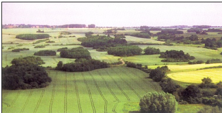
Zeugen der Geschichte: Halden des Steinkohlenbergbaus bei Wettin

Im Zeitraum von 1695 bis 1893 betrug die Gesamtförderung nicht ganz 2,5 Mill. t, also 12.300 t im Jahresdurchschnitt. Zur notwendigen Stilllegung der Wettiner Gruben wird vermerkt: „Die Einstellung des Betriebes ist größtenteils deswegen erfolgt, weil tatsächlich in den vorhandenen Schächten die Kohlen abgebaut waren. Man hatte es unterlassen, rechtzeitig nach Osten hin auszurichten. Der Bergbaubetrieb war auf viele Schächte verzettelt und ohne einheitlichen Betriebsplan geführt worden. Die wünschenswerte Aufschließung des Feldes nach Osten hin wurde nur durch Bohrlöcher vorgenommen, die viel zuverlässigere Aufschließung von bereits vorhandenen Schächten aus wurde dagegen vernachlässigt. Da der Staat in der damaligen flauen Zeit kein Geld für umfangreiche Versuchsarbeiten aufwenden wollte, war die Einstellung des Betriebes die natürliche Folge.