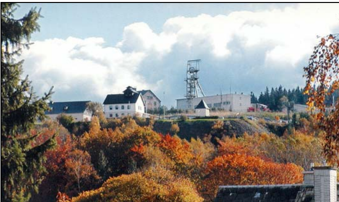
Blick zum „Sauberg“ bei Ehrenfriedersdorf - mit dem Fördergerüst von Schacht II (Besucherbergwerk)