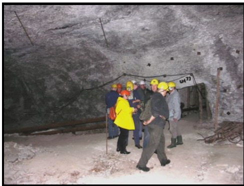
Besuchergruppe in den Wimmelburger Schlotten

Auf alle Fälle sollten aber alle Heimatfreunde, voran die Heimat- und die bergmännischen Traditionsvereine, auch im Interesse der öffentlichen Sicherheit für diese Möglichkeit kämpfen. Dann hätte man auch die Möglichkeit, sie für Forschungszwecke oder einen beschränkten Besucherverkehr gelegentlich oder regelmäßig zu befahren. Streit wird es geben wegen der Trägerschaft für ein solches Unterfangen. Aber leichtfertig vom Tisch wischen sollte man es nicht.