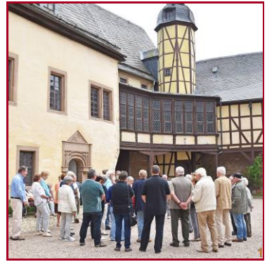
Vom Burghof aus begannen die Führungen

Mit diesen Informationen ausgerüstet konnte man sich voll auf die gestalteten Ausstellungen konzentrieren. Davon hatte Burg & Schloss Allstedt einiges zu bieten. So die: Spätmittelalterliche Burgeküche mit großer Hofstube, eine umfangreiche Thomas Müntzer Ausstellung, welche an diesem Tag unser besonderes Interesse auf sich zog, eine Goethe-Ausstellung, eine barocke Schlosskapelle und die umfangreiche Eisenkunstguss-Sammlung Horn aus Mägdesprung. Nach diesem informativen Rundgang kam die Stärkung mit Kaffee und Kuchen und den kameradschaftlichen Gesprächen im Burg-Café gerade recht. Es war eine gelungene Excursion.