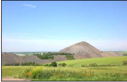
Der Haldenkomplex des Wolf-/Fortschrittschachtes mit der über 150 m hohen Spitzkegelhalde

Die Rosenstadt Sangerhausen GmbH, die Firma – project Schul- und Objekteinrichtungen GmbH und der Verein Mansfelder Berg- und Hüttenleute e.V. laden recht herzlich zur 7. organisierten Besteigung der Halde des Wolf-/Fortschrittschachtes bei Eisleben